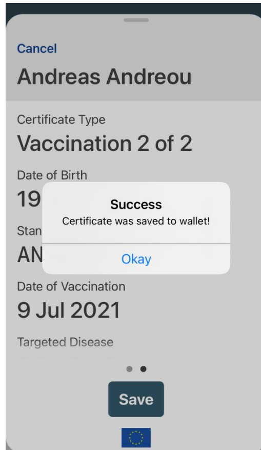
Εικόνα 7: Επιτυχής αποθήκευση του πιστοποιητικού

Μετά την επιτυχή εισαγωγή του κωδικού TAN, εμφανίζεται το μήνυμα Αποθήκευσης στην εφαρμογή ConPass Cyprus. Έχετε τώρα αποθηκεύσει με επιτυχία το πιστοποιητικό σας στην έξυπνη συσκευή.