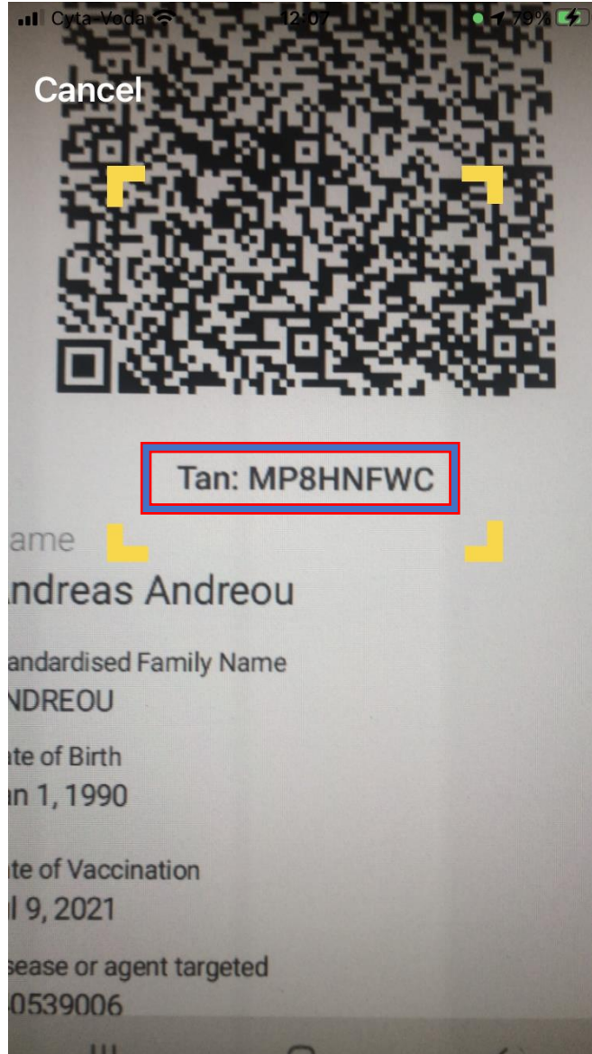
Εικόνα 3: Τοποθετήστε τα κίτρινα άκρα στον QR κωδικό

Για σάρωση του κωδικού, μετακινήστε την κάμερα της έξυπνης συσκευής σας, έτσι ώστε τα κίτρινα όρια να καλύπτουν τον QR κωδικό.