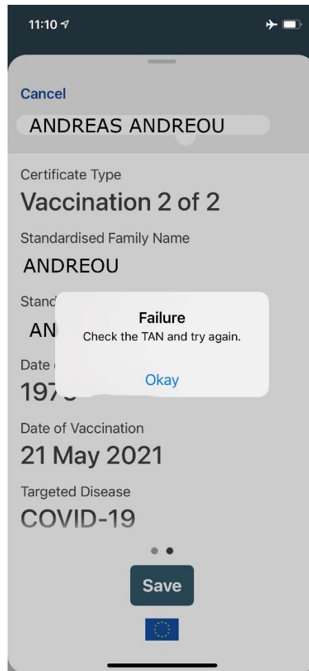
Εικόνα 5: Εικόνα λάθους αποθήκευσης του πιστοποιητικού λόγο 1. Μη σύνδεσης της έξυπνης συσκευής στο δίκτυο, 2. Λόγο εσφαλμένης καταχώρησης του κωδικού TAN, 3. Λόγο επαναχρησιμοποίησης του ίδιου κωδικού TAN.